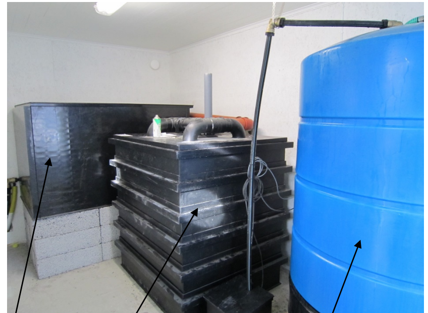
Axon sedimenterings tank