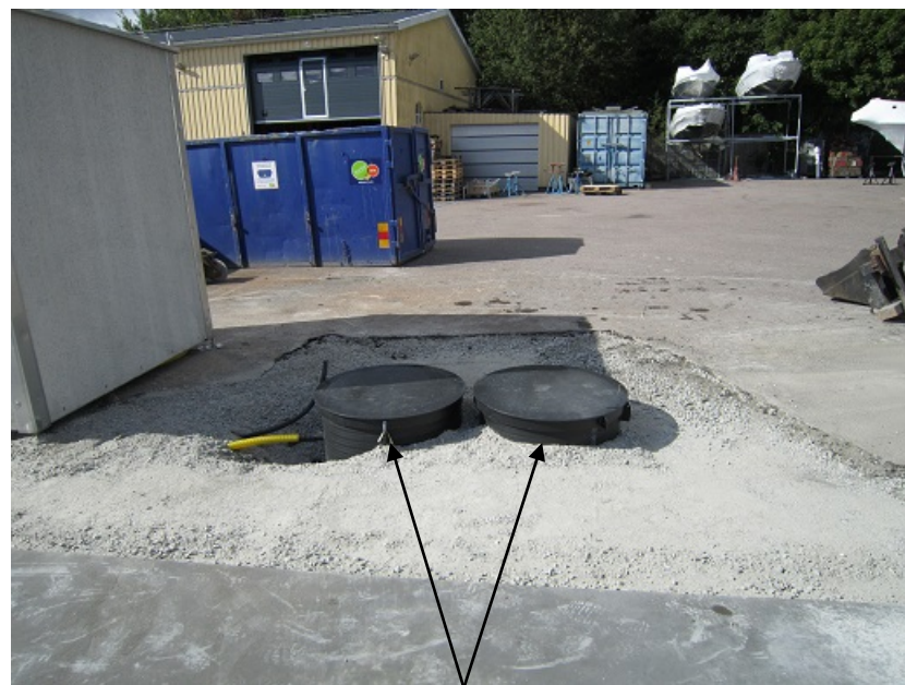
Axon 3-kammer brønner