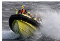
Håkon Kjølmoen .JPG