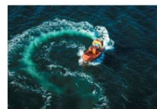
5 plass 2018 Jonathan E Sison.jpg