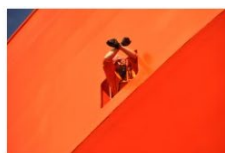
4 plass 2018 Claus Jacobsen - Danmark.jpg