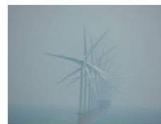
Geir Magne Skjølsvik.JPG