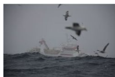
2 plass 2018 Bergþór Gunnlaugsson - Island.jpg