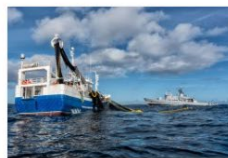
4 plass 2018 Håkon Kjølmoen.JPG