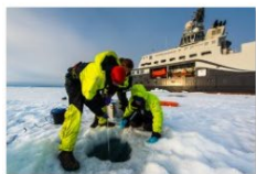
1 plass 2018 Andreas Wolden.jpg