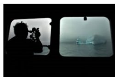
1 plass 2018 Guðmundur St. Valdimarsson - Island.jpg