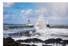
5 plass 2018 Frode André Koppang - Norge.jpg