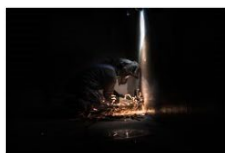
3 plass 2018 Johan Byström - Sverige.jpg