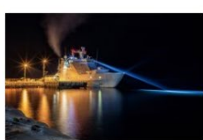
Håkon Kjølmoen .JPG