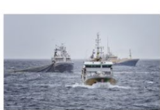
Håkon Kjølmoen .JPG