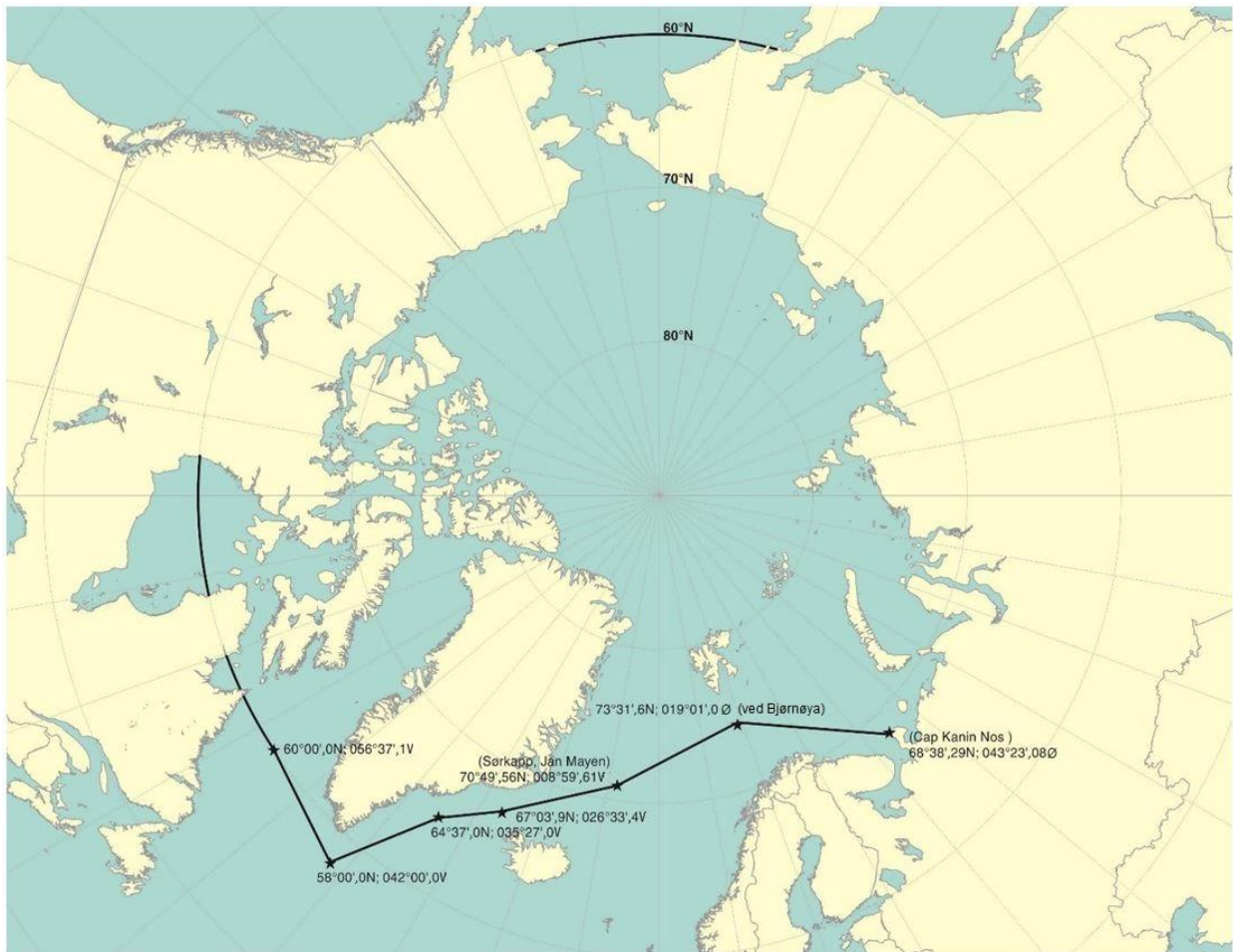
Figur 2 – Maksimum utbredelse av anvendelse i arktiske farvann 3