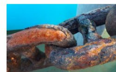
5. plass nordisk 2020 Harri Manninen - Finland.jpg