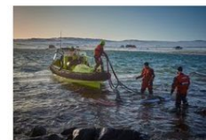
5. plass 2020 Knut Sandholm Jenssen KV Nordkapp.jpg