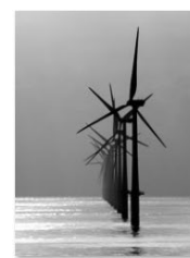
Hederlig omtale 2020 Håvard Melvær Edda Fjord.jpg