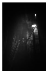
4. plass nordisk 2020 - Jörgen Språng - Sverige.jpg