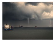
Hederlig omtale 2020 Håvard Melvær Edda Fjord.jpg