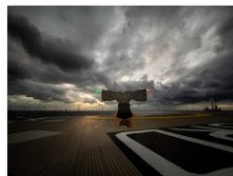
2. plass 2020 Håvard Melvær Edda Fjord.jpg